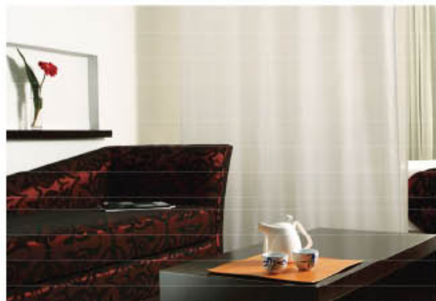
ECO-CHIC. Sigue el programa "Reserva neutra de emisiones de carbono".