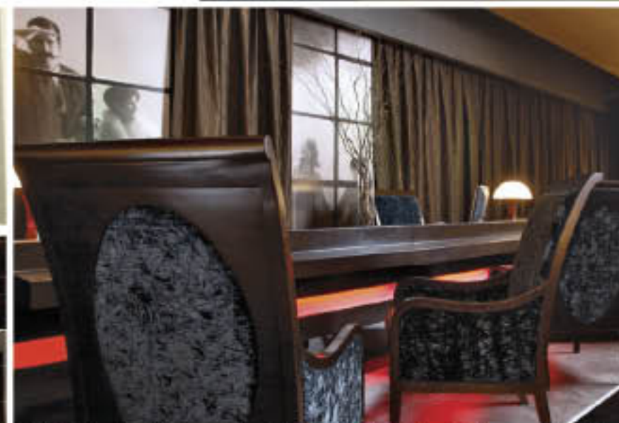
LÚDICO. Amplia biblioteca a disposición de los huéspedes; además, es pet friendly .