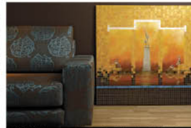
CLASE. Lujo que se siente en el mobiliario y los detalles.