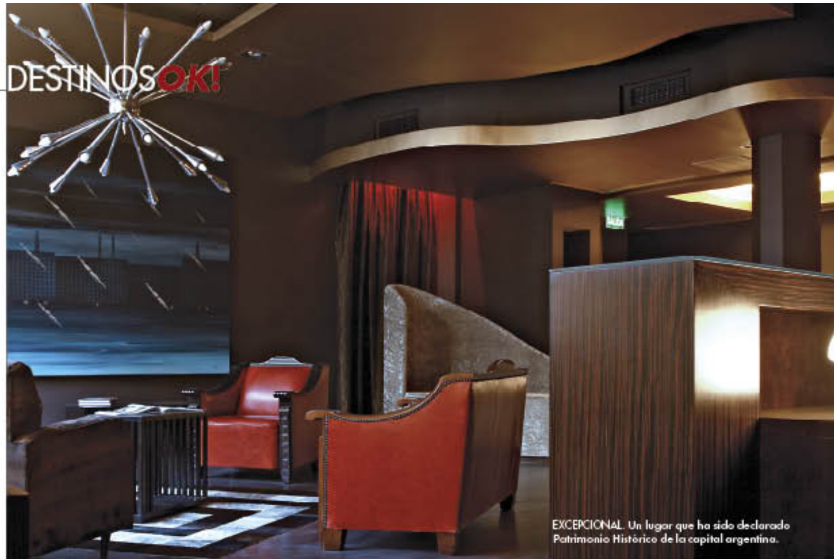
EXCEPCIONAL. Un lugar que ha sido declarado Patrimonio Histórico de la capital argentina.