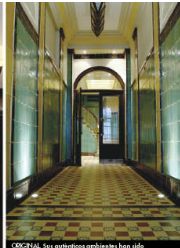
ORIGINAL. Sus auténticos ambientes han sido rescatados y adaptados.